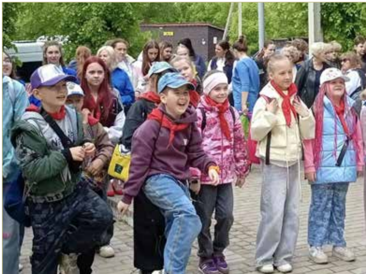
Обновлённой школе радуются и дети, и взрослые. В церемонии открытия принял участие глава Валдайского округа Юрий Стадэ.