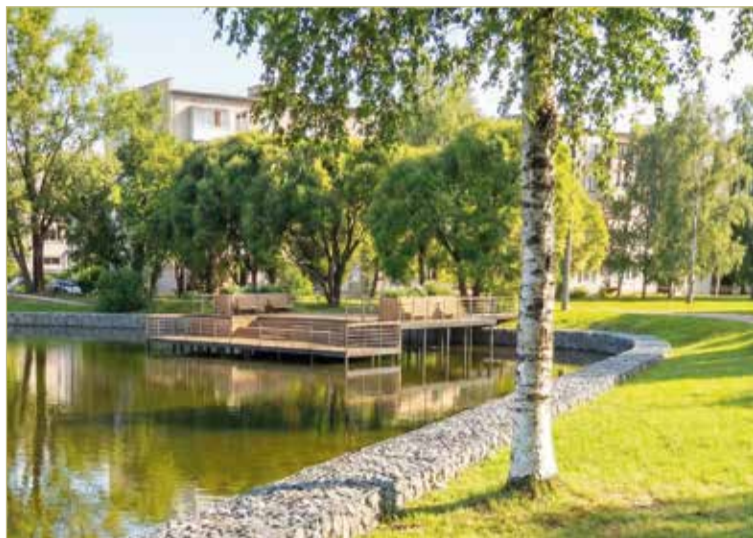
Чаще всего жители региона выбирают благоустройство прудов и естественных водоёмов. На фото Солёный пруд в Чудове – проект и вид сейчас.