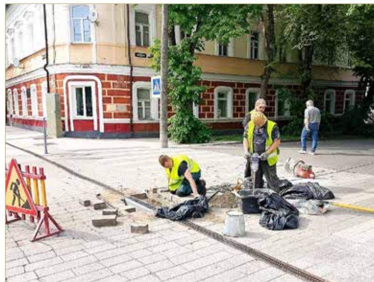
На Ильиной улице сотрудники «Городского хозяйства» частично заменили решётки на стоках и расшатавшуюся тротуарную плитку.