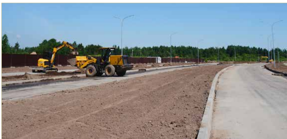
После завершения строительства Большой Московской улицы Державинский район города станет доступнее.