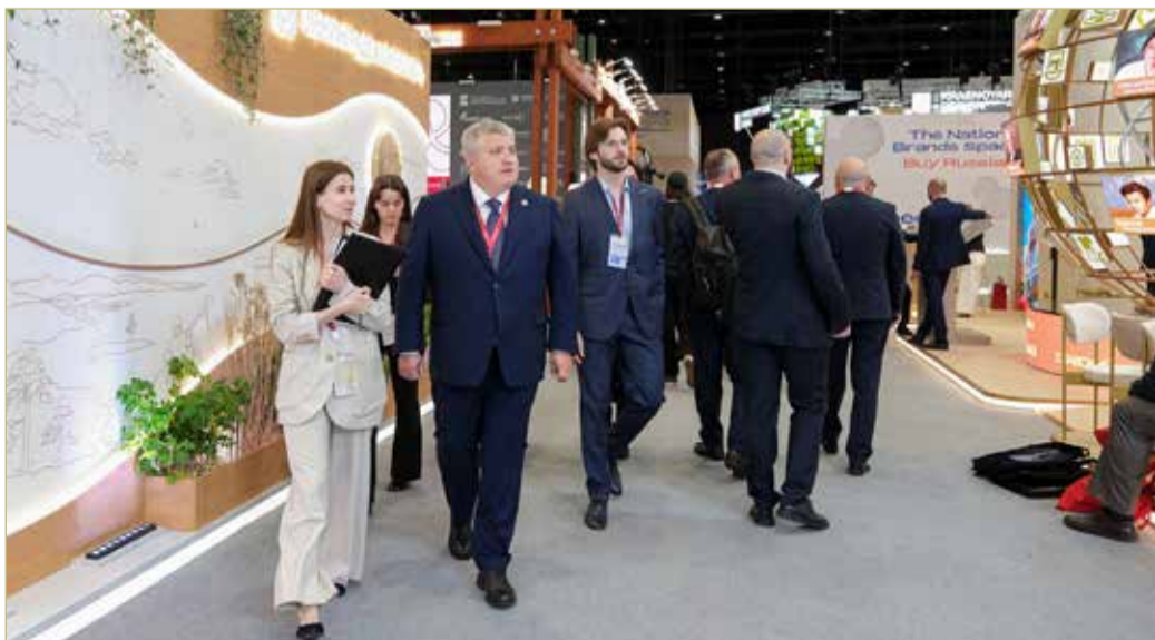
На полях ПМЭФ не бывает затишья.