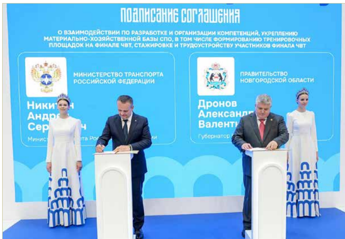
Готовить специалистов для транспортной отрасли Новгородская область будет совместно с Минтрансом России.