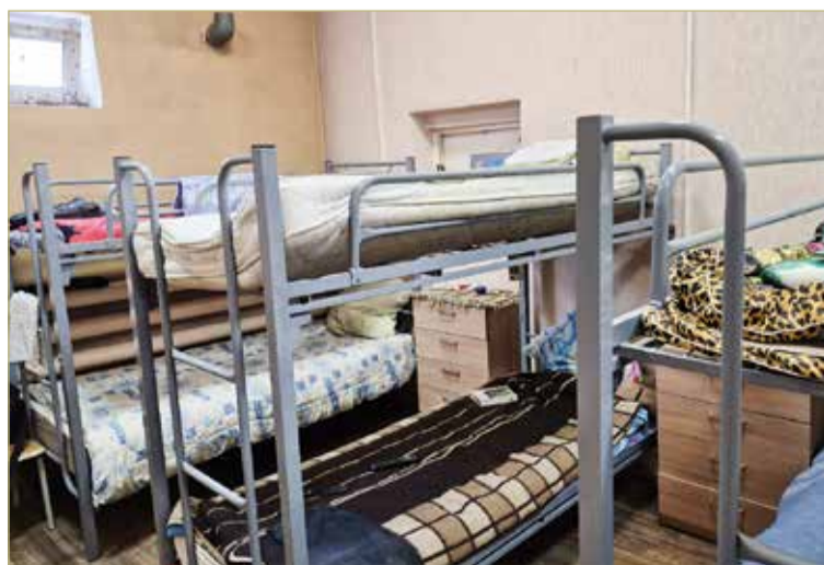
Ночлег в Центре предоставят каждому, кто в нём нуждается.

В настоящее время общественная организация «Центр помощи «Примирение» при поддержке Фонда президентских грантов реализует проект «Помощь рядом», целью которого является создание условий для ресоциализации и трудоустройства граждан, только что освобождённых из мест заключения и не имеющих постоянного места жительства.