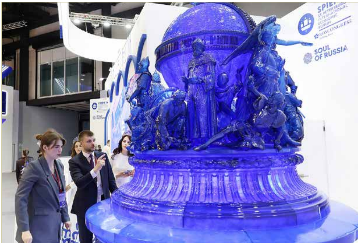
Сотрудники Новгородского музея-заповедника провели для гостей ПМЭФ экскурсии по памятнику «Тысячелетие России», одному из главных символов Великого Новгорода.

— Внимание сторон будет направлено на укомплектование соревновательных площадок ЧВТ необходимым оборудованием. РЖД направят специалистов для участия в соревновании, а также экспертов для судейства в индустриальном зачёте, — рассказал Александр Дронов.