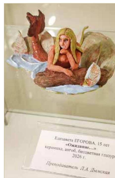
Каждую картину выставки дополняет скульптурный образ.

— Я сам очень люблю Великий Новгород и Новгородчину. С радостью посвящаю этой теме свои выставочные проекты. В прошлом году мы с ребятами размышляли: что, если бы наши архитектурные памятники, ныне утраченные, сохранились в альтернативной реальности? Сейчас этот проект путешествует по Новгородской области. В этом году было решено обратиться к фольклору. Все чудесные существа и все паранормальные места «Чудьрева» — это наше, родное. Материалы для дальнейшей творческой обработки мы искали в краеведческом отделе областной библиотеки в кремле. В итоге у каждой работы