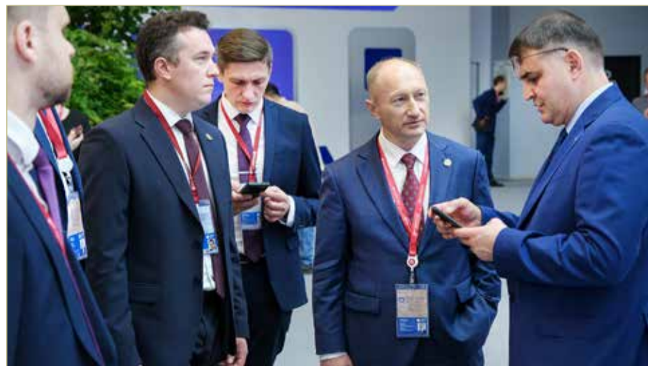
Замы губернатора подписали несколько соглашений, которые помогут привлечь новые инвестиции и создать рабочие места. Это проекты в сферах туризма, промышленности и подготовки специалистов.