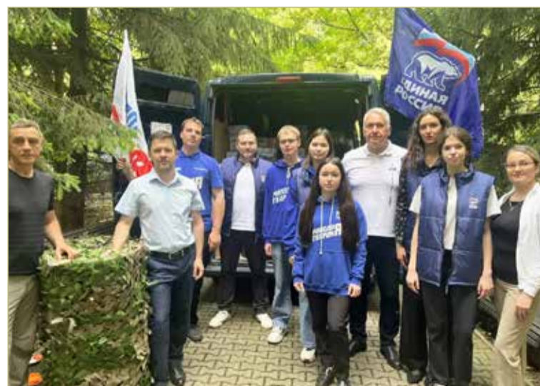
За ленточку груз доставят волонтеры новгородского центра «Наша Земля».