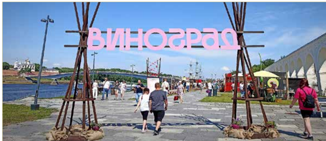
Так выглядит вход на самую вкусную и весёлую площадку города этой недели.

Пока одни слушают музыку, другие учатся жарить идеальный стейк, третьи смотрят немое кино под живую музыку, четвёртые играют в настоль-