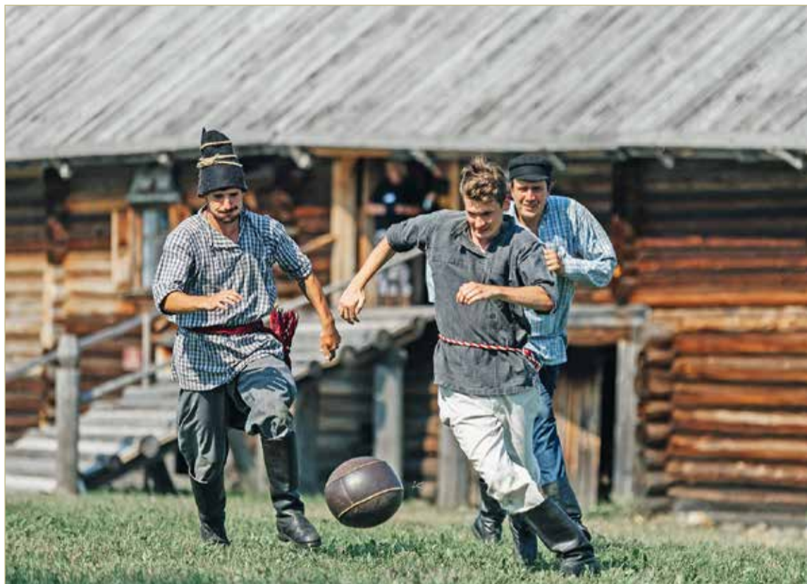
Кила — национальная русская игра, настоящая мужицкая забава.

— Бросил клич своим ребятам, друзьям, предложил просто поиграть. Те описания, что встречались мне в этнографических источниках, были очень общие. Из них мы достоверно знаем, что цель килы — донести мяч до цели, «города». «Город» назначается в начале состязания: это может быть крыльцо церкви или конец улицы, всё, что угодно. Границы поля тоже определены заранее. Второе, что мы знали, — это силовая игра. Разрешены приёмы борьбы. Мяч можно вырывать, толкать, в общем, брутальная, мужицкая забава. И наконец, третье, разделение игры на землю и воздух. С земли поднимаем мяч только ногами, себе